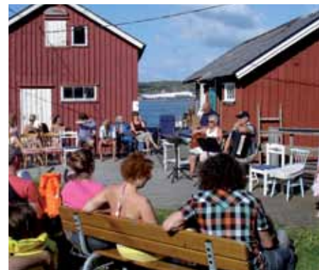
23 juli 2011