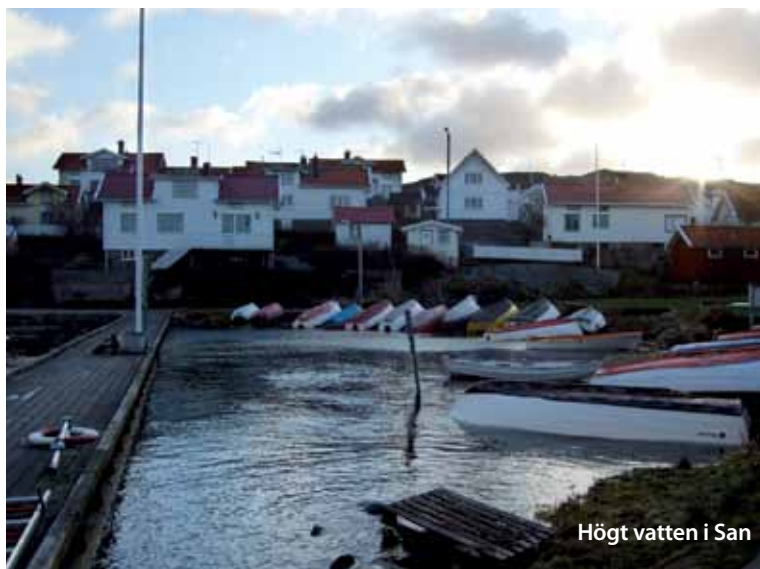
Högt vatten i San