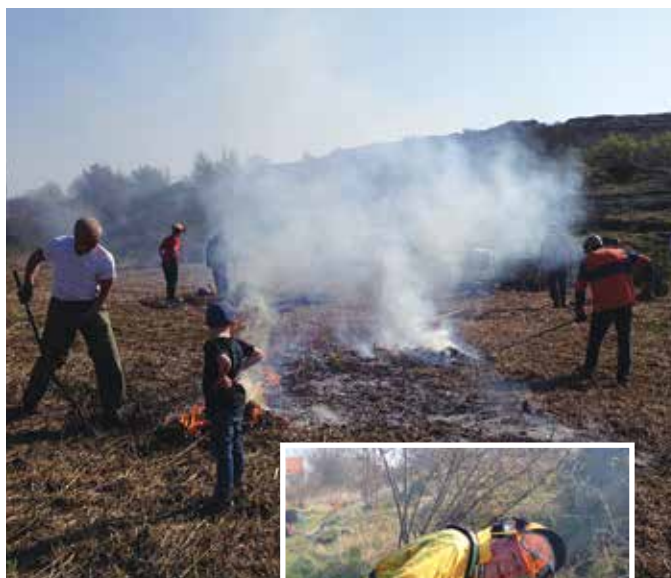
Vi har röjt ängen väster ut!