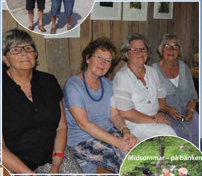
Midsommar – på bänken