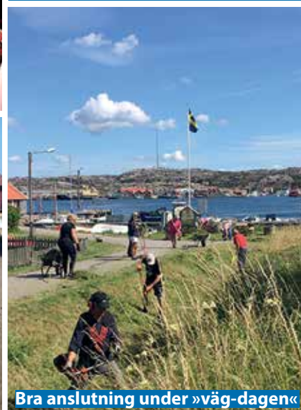
Bra anslutning under »väg-dagen«