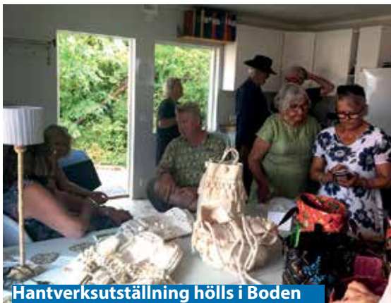
Hantverksutställning hölls i Boden