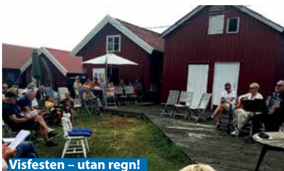
Visfesten – utan regn!