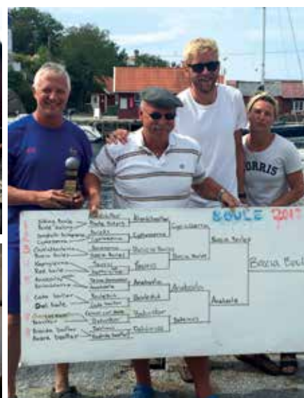
Vinnarna av Boule-tävlingen 2019