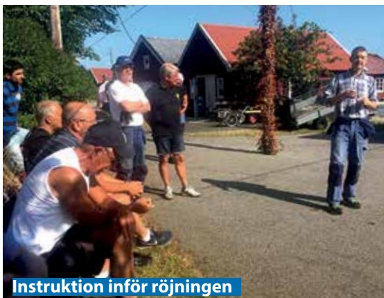
Instruktion inför röjningen