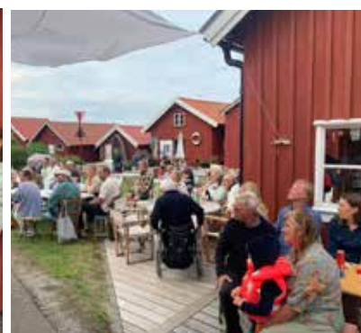
KUL MED QUIZZ MED MÅNGA DELTAGARE. BODEN ÄR EN GIVEN TRÄFFPUNKT!