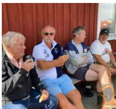
VI HJÄLPS ÅT ATT HÅLLA KALVEN I BRA SKICK GENOM GEMENSAMT ARBETE UNDER VÄGDAGEN OCH RÖJNINGAR. EN STUND PÅ BÄNKEN VAR EN SKÖN BELÖNING.