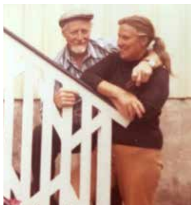
Så minns många av oss dem.