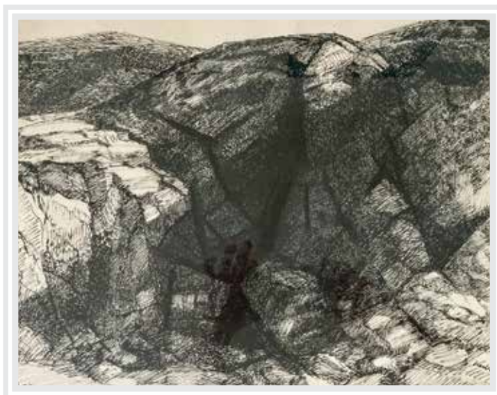
Tavlan hänger hemma hos oss och textilskalbaggen likaså.