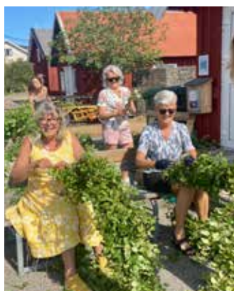
I DET TRADITIONELLA MIDSOMMARFIRANDET DELTOG, SOM VANLIGT, MÅNGA!