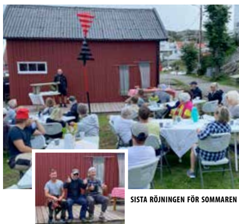
SISTA RÖJNINGEN FÖR SOMMAREN AVSLUTADES MED FIN-FIKA. EN NY BÄNK FICK »PROVSITTAS«.