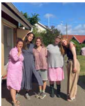
FEM UNGA KONSTNÄRINOR TILLBRINGADE EN VECKA PÅ KALVEN INOM »RESIDENS« PROJEKTET.

Trots blåsten och kylan innehöll SOMMAREN -23 på Tjörnekalv många aktiviteter.